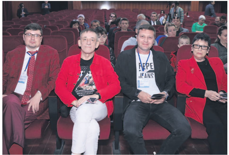
Педагоги ГИТИСа и руководители театров стали зрителями.