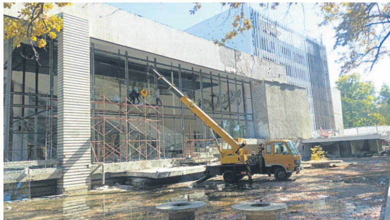
Продолжается ремонт театра.

териал и желательно, чтобы это было произведение отечественного драматурга. Кроме занятий в Самарканде была интересная и яркая культурная программа. Запомнилось посещение театра исторического костюма «Эл мероси». Мне кажется, подобный проект можно успешно реализовать в Кыргызстане. Нам тоже есть что показать и мы над этим уже начали думать. Кста-