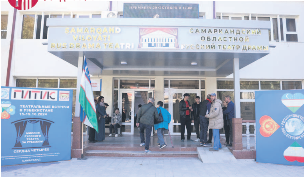
Гостей принимает Самаркандский областной русский театр драмы.