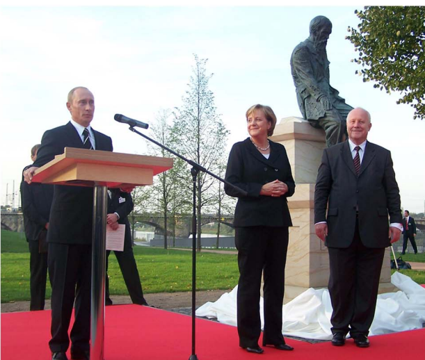
Канцлер ФРГ Ангела Меркель, Президент РФ Владимир Путин и премьер-министр Саксонии Георг Мильбрадт открывают 10.10.2006 г. памятник Достоевскому в Дрездене.

получить место на берегу Эльбы, на набережной «Новая терраса» между Саксонским парламентом и Конгрессцентром. В 2006 году столица Саксонии праздновала 800-летний юбилей. В том же году Немецко-Русский институт культуры отмечал 185-летие со дня рождения Достоевского, а также 125-летие со дня его смерти. Той же осенью впервые в Дрездене проходил 6-ой Санкт-Петербургский диалог.